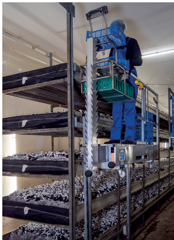
Foto: Elektrische plukliften zorgen voor betere arbeidsomstandigheden en verhogen de veiligheid.

Binnen Geurts Champignons is innovatie een belangrijk thema. Continu monitoren we de processen en waar mogelijk passen we nieuwe innovaties toe. Zo creëren we een prettige, langdurige en veilige werkomgeving voor ons team. Onze werknemers denken actief mee en krijgen kansen en de ruimte zich te ontwikkelen. Het zo efficiënt mogelijk inregelen van de werkzaamheden zorgt niet alleen voor minder fysieke belasting maar ook dat de werkzaamheden met plezier en veilig kunnen worden uitgevoerd.